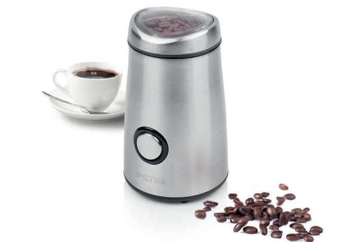
COFFEE GRINDER STAINLESS STEEL DELUXE M 54

PARTS DESCRIPTION / ONDERDELENBESCHRIJVING / DESCRIPTION DES PIÈCES / TEILEBESCHREIBUNG / DESCRIPCION DE LAS PIEZAS / DESCRICÃO DOS COMPONENTES / DESCRIZIONE DELLE PARTI / BESKRIVNING AV DELAR / OPIS CZĘŚCI / POPIS SOUČÁSTÍ / POPIS SOUČASTÍ