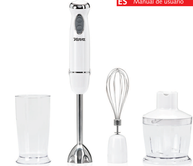
NOVA STICK MIXER SET 02.220200.01.001

ONDERDELENBESCHRIJVING / PARTS DESCRIPTION / DESCRIPTION DES PIÉCES / TEILEBESCHREIBUNG / DESCRIPCIÓN DE LAS PIEZAS