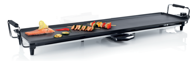
GRIDDLE XXL 02.103016.01.001

PARTS DESCRIPTION / ONDERDELENBESCHRIJVING / DESCRIPTION DES PIÈCES / TEILEBESCHREIBUNG / DESCRIPCIÓN DE LAS PIEZAS / DESCRIÇÃO DOS COMPONENTES / DESCRIZIONE DELLE PARTI / BESKRIVNING AV DELAR / OPIS CZĘŚCI / POPIS SOUČÁSTÍ / POPIS SÚČASTÍ