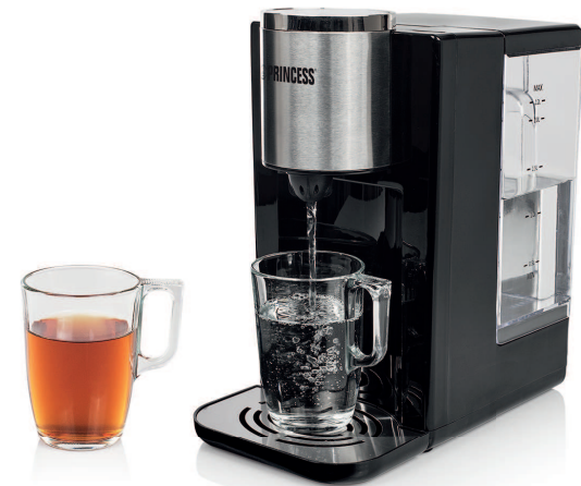
Digital hot water dispenser 01.237000.01.001

PARTS DESCRIPTION / ONDERDELENBESCHRIJVING / DESCRIPTION DES PIÈCES / TEILEBESCHREIBUNG / DESCRIPCIÓN DE LAS PIEZAS / DESCRIÇÃO DOS COMPONENTES / DESCRIZIONE DELLE PARTI / BESKRIVNING AV DELAR / OPIS CZĘŚCI / POPIS SOUČÁSTÍ / POPIS SOUČASTI / ОПИСАНИЕ ЗАПЧАСТИ