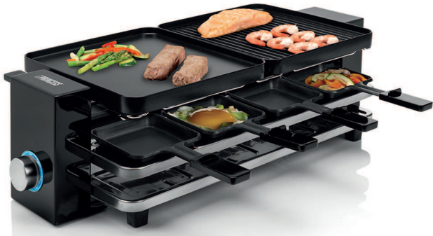
Black Label Raclette 8 01.162256.01.245

PARTS DESCRIPTION / ONDERDELENBESCHRIJVING / DESCRIPTION DES PIÉCES / TEILEBESCHREIBUNG / DESCRIPCIÓN DE LAS PIEZAS / DESCRIÇÃO DOS COMPONENTES / DESCRIZIONE DELLE PARTI / BESKRIVNING AV DELAR / OPIS CZĘŚCI / POPIS SOUČÁSTÍ / POPIS SUČASTI