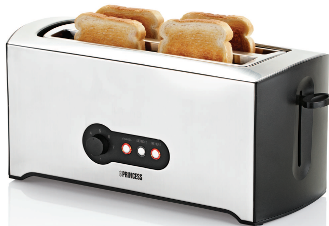
Toaster Robust Deluxe 01.142373.01.001

PARTS DESCRIPTION / ONDERDELENBESCHRIJVING / DESCRIPTION DES PIÉCES / TEILEBESCHREIBUNG / DESCRIPCIÓN DE LAS PIEZAS / DESCRIÇÃO DOS COMPONENTES / OPIS CZĘŚCI / DESCRIZIONE DELLE PARTI / BESKRIVNING AV DELAR / POPIS SOUČÁSTI / POPIS SÚČASTÍ