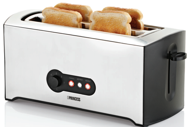
Toaster Robust Deluxe 01.142373.01.001

PARTS DESCRIPTION / ONDERDELENBESCHRIJVING / DESCRIPTION DES PIÉCES / TEILEBESCHREIBUNG / DESCRIPCION DE LAS PIEZAS / DESCRIÇÃO DOS COMPONENTES / OPIS CZĘŚCI / DESCRIZIONE DELLE PARTI / BESKRIVNING AV DELAR / POPIS SOUČASTÍ / POPIS SÚČASTÍ