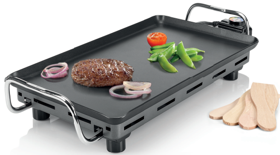
Table Chef Pro 01.102850.01.650

PARTS DESCRIPTION / ONDERDELENBESCHRIJVING / DESCRIPTION DES PIÈCES / TEILEBESCHREIBUNG / DESCRIPCION DE LAS PIEZAS / DESCRIÇÃO DOS COMPONENTES / DESCRIZIONE DELLE PARTI / BESKRIVNING AV DELAR / OPIS CZĘŚCI / POPIS SOUČASTÍ / POPIŠ SUČASTÍ / ОПИСАНИЕ ЗАПЧАСТЕЙ