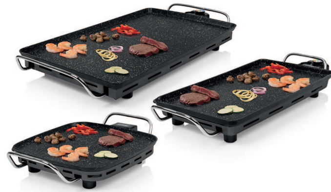
Mini Table Chef | Table Chef Pro | Table Chef XXL 01.102214.01.750 | 01.102215.01.750 | 01.102216.01.750

PARTS DESCRIPTION / ONDERDELENBESCHRIJVING / DESCRIPTION DES PIÈCES / TEILEBESCHREIBUNG / DESCRIPCIÓN DE LAS PIEZAS / DESCRIÇÃO DOS COMPONENTES / DESCRIZIONE DELLE PARTI / BESKRIVNING AV DELAR / OPIS CZĘŚCI / POPIS SOUČÁSTI / POPIS SUČASTI / ОПИСАНИЕ ЗАПЧАСТИ