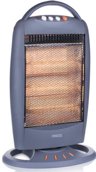
Electric heater (Halogen) 01.345019.09.001