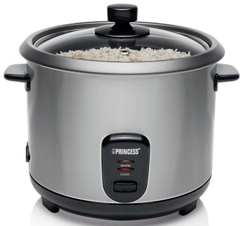
Rice Cooker 01.271941.01.750

PARTS DESCRIPTION / ONDERDELENBESCHRIJVING / DESCRIPTION DES PIÈCES / TEILEBESCHREIBUNG / DESCRIPCIÓN DE LAS PIEZAS / DESCRIÇÃO DOS COMPONENTES / DESCRIZIONE DELLE PARTI / BESKRIVNING AV DELAR / OPIS CZĘŚCI / POPIS SOUČÁSTÍ / POPIS SUČASTI / ОПИСАНИЕ ЗАПЧАСТИ