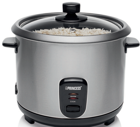
Rice Cooker 01.271941.01.750

PARTS DESCRIPTION / ONDERDELENBESCHRIJVING / DESCRIPTION DES PIÉCES / TEILEBESCHREIBUNG / DESCRIPCION DE LAS PIEZAS / DESCRIÇÃO DOS COMPONENTES / DESCRIZIONE DELLE PARTI / BESKRIVNING AV DELAR / OPIS CZĘŚCI / POPIS SOUČÁSTÍ / POPIS SOUČASTI / ОПИСАНИЕ ЗАПЧАСТИ