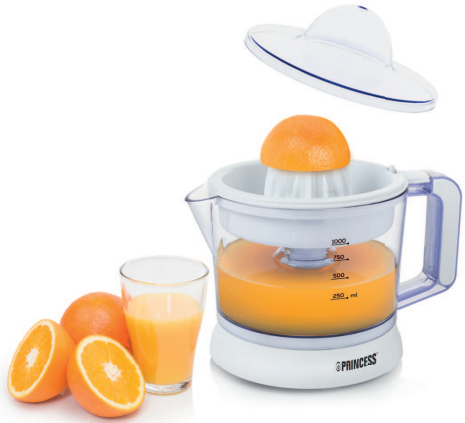
Citrus Juicer Classic عصرارة الحمضيات كلاسيك بلاك 01.201004.04.001