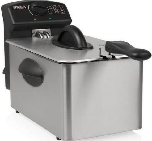
Deep Fryer 01.182642.01.001

PARTS DESCRIPTION / ONDERDELENBESCHRIJVING / DESCRIPTION DES PIÈCES / TEILEBESCHREIBUNG / DESCRIPCIÓN DE LAS PIEZAS / DESCRIÇÃO DOS COMPONENTES / DESCRIZIONE DELLE PARTI / BESKRIVNING AV DELAR / OPIS CZĘŚCI / POPIS SOUČÁSTÍ / POPIS SUČASTÍ / ОПИСАНИЕ ЗАПЧАСТЕЙ