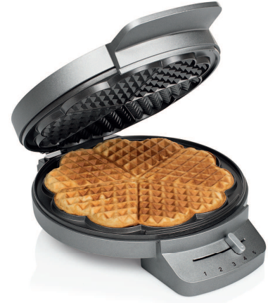
Waffle Iron DeLuxe 01.132380.01.001

PARTS DESCRIPTION / ONDERDELENBESCHRIJVING / DESCRIPTION DES PIÈCES / TEILEBESCHREIBUNG / DESCRIPCIÓN DE LAS PIEZAS / DESCRICÃO DOS COMPONENTES / DESCRIZIONE DELLE PARTI / BESKRIVNING AV DELAR / OPIS CZĘŚCI / POPIS SOUČÁSTÍ / POPIS SUČASTI