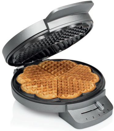
Waffle Iron DeLuxe 01.132380.01.001

PARTS DESCRIPTION / ONDERDELENBESCHRIJVING / DESCRIPTION DES PIÈCES / TEILEBESCHREIBUNG / DESCRIPCIÓN DE LAS PIEZAS / DESCRIZIONE DEI COMPONENTI / DESCRIZIONE DELLE PARTI / BESKRIVNING AV DELAR / OPIS CZĘŚCI / POPIS SOUČÁSTI / POPIS SUČASTI