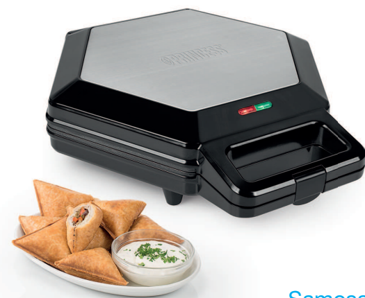
Samosa & Snack maker 01.123001.01.001

PARTS DESCRIPTION / ONDERDELENBESCHRIJVING / DESCRIPTION DES PIÈCES / TEILEBESCHREIBUNG / DESCRIPCIÓN DE LAS PIEZAS / DESCRIÇÃO DOS COMPONENTES / DESCRIZIONE DELLE PARTI / BESKRIVNING AV DELAR / OPIS CZĘŚCI / POPIS SOUČÁSTÍ / POPIS SUČASTÍ / ОПИСАНИЕ ЗАГЧАСТИ