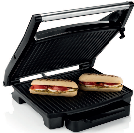
Panini Grill 01.112416.01.001

PARTS DESCRIPTION / ONDERDELENBESCHRIJVING / DESCRIPTION DES PIÈCES / TEILEBESCHREIBUNG / DESCRIPCIÓN DE LAS PIEZAS / DESCRIÇÃO DOS COMPONENTES / DESCRIZIONE DELLE PARTI / BESKRIVNING AV DELAR / OPIS CZĘŚCI / POPIS SOUČÁSTÍ / POPIS SUČASTÍ / ОПИСАНИЕ ЗАПЧАСТИ