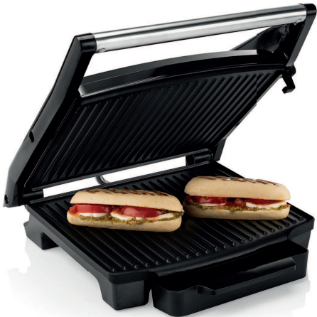
Panini Grill 01.112416.01.001

PARTS DESCRIPTION / ONDERDELENBESCHRIJVING / DESCRIPTION DES PIÈCES / TEILEBESCHREIBUNG / DESCRIPCIÓN DE LAS PIEZAS / DESCRIÇÃO DOS COMPONENTES / DESCRIZIONE DELLE PARTI / BESKRIVNING AV DELAR / OPIS CZĘŚCI / POPIS SOUČÁSTÍ / POPIS SOUČASTÍ / ОПИСАНИЕ ЗАПЧАСТІ