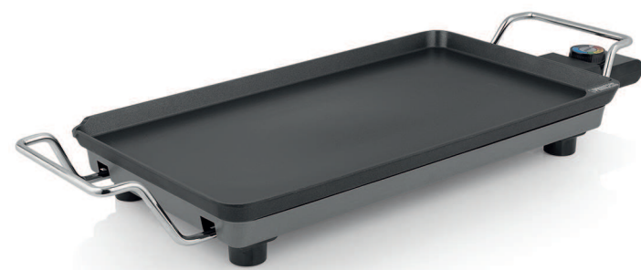
Table Chef Pro Classic 01.102300.01.014

The Green Dot is the registered trademark of Der Grüne Punkt – Duales System Deutschland GmbH and is protected as a trademark worldwide. The logo may only be used by customers of DSD GmbH holding a valid trademark usage contract or by engaged waste management companies within the Federal Republic of Germany. This also applies to reproduction of the logo by third parties in a dictionary, an encyclopaedia or an electronic database containing a reference manual.