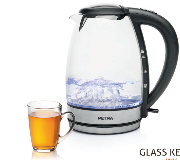
GLASS KETTLE WK 61.07

PARTS DESCRIPTION / ONDERDELENBESCHRIJVING / DESCRIPTION DES PIÈCES / TEILEBESCHREIBUNG / DESCRIPCIÓN DE LAS PIEZAS / DESCRIÇÃO DOS COMPONENTES / DESCRIZIONE DELLE PARTI / BESKRIVNING AV DELAR / OPIS CZĘŚCI / POPIS SOUČÁSTÍ / POPIS SUČASTI