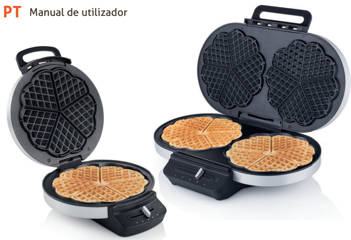
WAFFLE IRON STAINLESS STEEL DOUBLE WAFFLE IRON STAINLESS STEEL WA 24.34 / WA 25.34

PARTS DESCRIPTION / ONDERDELENBESCHRIJVING / DESCRIPTION DES PIÈCES / TEILEBESCHREIBUNG / DESCRIPCION DE LAS PIEZAS / DESCRIÇÃO DOS COMPONENTES / DESCRIZIONE DELLE PARTI / BESKRIVNING AV DELAR / OPIS CZĘŚCI / POPIS SOUČÁSTÍ / POPIS SOUČASTÍ