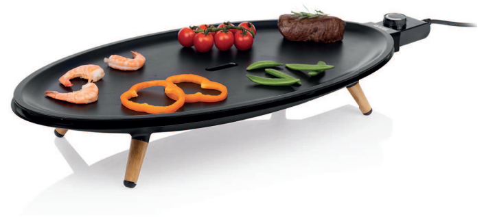
OVAL TABLE GRILL 02.102235.01.001

ONDERDELENBESCHRIJVING / PARTS DESCRIPTION / DESCRIPTION DES PIÈCES / TEILEBESCHREIBUNG / DESCRIPCIÓN DE LAS PIEZAS / DESCRIZIONE DELLE PARTI / DESCRICÃO DOS COMPONENTES / BESKRIVNING AV DELAR / OPIS CZĘŚCI / POPIS SOUČÁSTÍ / POPIS SUČASTÍ / ОПИСАНИЕ ЗАПЧАСТЕЙ