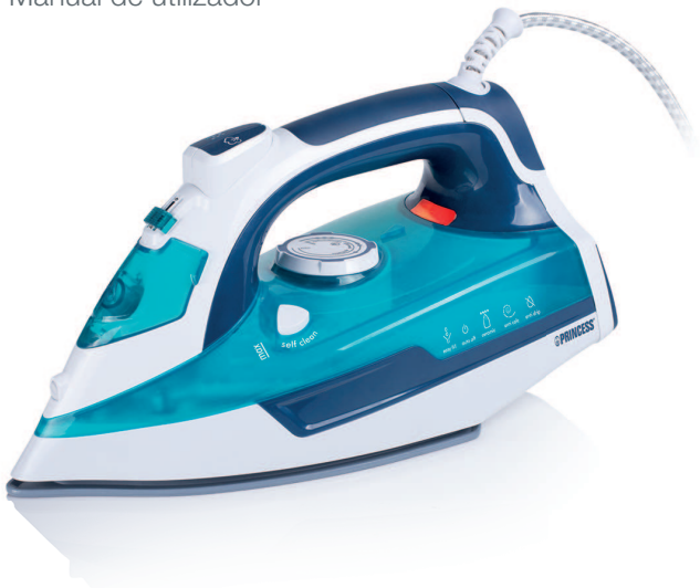
Steam iron 01.322729.10.001

PARTS DESCRIPTION / ONDERDELENBESCHRIJVING / DESCRIPTION DES PIÈCES / TEILEBESCHREIBUNG / DESCRIPCION DE LAS PIEZAS / DESCRIÇÃO DOS COMPONENTES / DESCRIZIONE DELLE PARTI / BESKRIVNING AV DELAR / OPIS CZĘŚCI / POPIS SOUČÁSTÍ / POPIS SÚČASTÍ