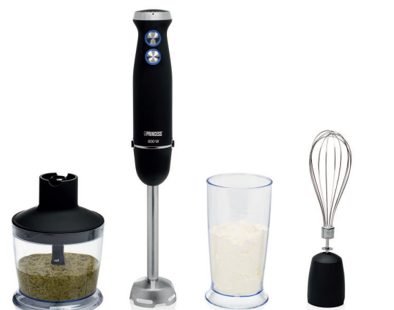
Hand blender set 01.221220.01.001

PARTS DESCRIPTION / ONDERDELENBESCHRIJVING / DESCRIPTION DES PIÈCES / TEILEBESCHREIBUNG / DESCRIPCIÓN DE LAS PIEZAS / DESCRICÃO DOS COMPONENTES / DESCRIZIONE DELLE PARTI / BESKRIVNING AV DELAR / OPIS CZĘŚCI / POPIS SOUČÁSTÍ / POPIS SUČASTI