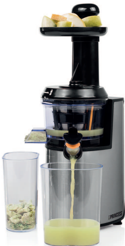
Slow Juicer 01.202046.01.001

PARTS DESCRIPTION / ONDERDELENBESCHRIJVING / DESCRIPTION DES PIÈCES / TEILEBESCHREIBUNG / DESCRIPCION DE LAS PIEZAS / DESCRIÇÃO DOS COMPONENTES / DESCRIZIONE DELLE PARTI / BESKRIVNING AV DELAR / OPIS CZĘŚCI / POPIS SOUČÁSTÍ / POPIS SOUČASTÍ / ОПИСАНИЕ ЗАПЧАСТІ