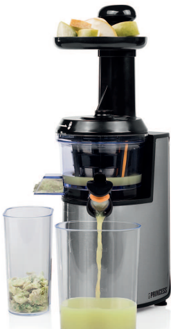
Slow Juicer 01.202046.01.001

PARTS DESCRIPTION / ONDERDELENBESCHRIJVING / DESCRIPTION DES PIÈCES / TEILEBESCHREIBUNG / DESCRIPCION DE LAS PIEZAS / DESCRIÇÃO DOS COMPONENTES / DESCRIZIONE DELLE PARTI / BESKRIVNING AV DELAR / OPIS CZĘŚCI / POPIS SOUČÁSTÍ / POPIS SUČASTI / ОПИСАНИЕ ЗАПЧАСТИ