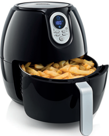
Black Label Digital Aerofryer XL 01.182007.01.245

PARTS DESCRIPTION / ONDERDELENBESCHRIJVING / DESCRIPTION DES PIÈCES / TEILEBESCHREIBUNG / DESCRIPCIÓN DE LAS PIEZAS / DESCRIÇÃO DOS COMPONENTES / DESCRIZIONE DELLE PARTI / BESKRIVNING AV DELAR / OPIS CZĘŚCI / POPIS SOUČÁSTÍ / POPIS SUČASTI / ОПИСАНИЕ ЗАПЧАСТИ