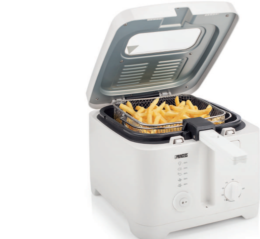
Cool Wall Deep Fryer 01.180306.01.001

PARTS DESCRIPTION / ONDERDELENBESCHRIJVING / DESCRIPTION DES PIÈCES / TEILEBESCHREIBUNG / DESCRIPCIÓN DE LAS PIEZAS / DESCRIÇÃO DOS COMPONENTES / DESCRIZIONE DELLE PARTI / BESKRIVNING AV DELAR / OPIS CZĘŚCI / POPIS SOUČÁSTÍ / POPIS SOUČASTI