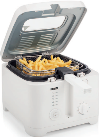
Cool Wall Deep Fryer 01.180306.01.001

PARTS DESCRIPTION / ONDERDELENBESCHRIJVING / DESCRIPTION DES PIÈCES / TEILEBESCHREIBUNG / DESCRIPCION DE LAS PIEZAS / DESCRIÇÃO DOS COMPONENTES / DESCRIZIONE DELLE PARTI / BESKRIVNING AV DELAR / OPIS CZĘŚCI / POPIS SOUČÁSTÍ / POPIS SOUČASTI