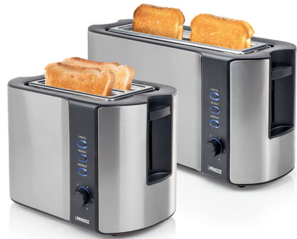
Toaster / Long Slot Toaster 01.142352.01.001 / 01.142353.01.001

PARTS DESCRIPTION / ONDERDELENBESCHRIJVING / DESCRIPTION DES PIÈCES / TELEBEŠREIBUNG / DESCRIPCIÓN DE LAS PIEZAS / DESCRIÇÃO DOS COMPONENTES / DESCRIZIONE DELLE PARTI / BESKRIVNING AV DELAR / OPIS CZĘŚCI / POPIS SOUČÁSTÍ / POPIS SOUČASTI / ОПИСАНИЕ ЗАПЧАСТІ