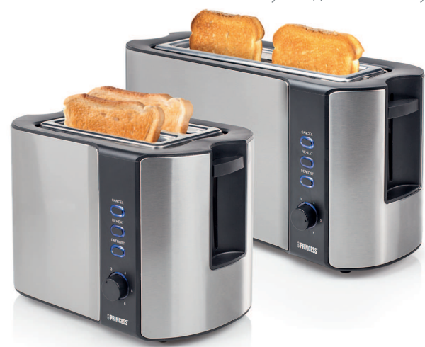
Toaster / Long Slot Toaster 01.142352.01.001 / 01.142353.01.001

PARTS DESCRIPTION / ONDERDELENBESCHRIJVING / DESCRIPTION DES PIÈCES / TEILEBESCHREIBUNG / DESCRIPCIÓN DE LAS PIEZAS / DESCRIÇÃO DOS COMPONENTES / DESCRIZIONE DELLE PARTI / BESKRIVNING AV DELAR / OPIS CZĘŚCI / POPIS SOUČÁSTI / POPIS SUČASTI / ОПИСАНИЕ ЗАПЧАСТИ