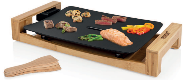
Table Chef Pure Compact 01.103010.01.001

PARTS DESCRIPTION / ONDERDELENBESCHRIJVING / DESCRIPTION DES PIÈCES / TEILEBESCHREIBUNG / DESCRIPCIÓN DE LAS PIEZAS / DESCRIÇÃO DOS COMPONENTES / DESCRIZIONE DELLE PARTI / BESKRIVNING AV DELAR / OPIS CZĘŚCI / POPIS SOUČÁSTI / POPIS SOUČÁSTI / ОПИСАНИЕ ЗАПЧАСТИ