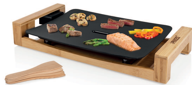
Table Chef Pure Compact 01.103010.01.001

PARTS DESCRIPTION / ONDERDELENBESCHRIJVING / DESCRIPTION DES PIÈCES / TEILEBESCHREIBUNG / DESCRIPCIÓN DE LAS PIEZAS / DESCRIÇÃO DOS COMPONENTES / DESCRIZIONE DELLE PARTI / BESKRIVNING AV DELAR / OPIS CZĘŚCI / POPIS SOUČÁSTÍ / POPIS SOUČASTÍ / ОПИСАНИЕ ЗАПЧАСТИ