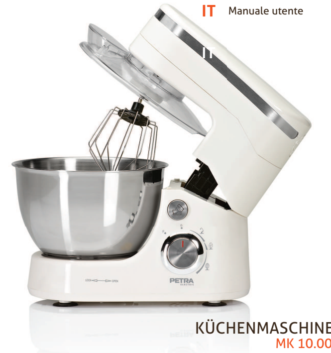
KÜCHENMASCHINE MK 10.00

EN Instruction manual FR Mode d'emploi DE Bedienungsanleitung IT Manuale utente