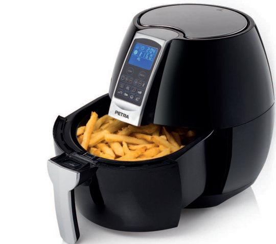
DIGITAL AEROFRYER XL FT 11.07

PARTS DESCRIPTION / ONDERDELENBESCHRIJVING / DESCRIPTION DES PIÈCES / TEILEBESCHREIBUNG / DESCRIPCION DE LAS PIEZAS / DESCRICÃO DOS COMPONENTES / DESCRIZIONE DELLE PARTI / BESKRIVNING AV DELAR / OPIS CZĘŚCI / POPIS SOUČÁSTÍ / POPIS SUČASTI وصف الأجزاء