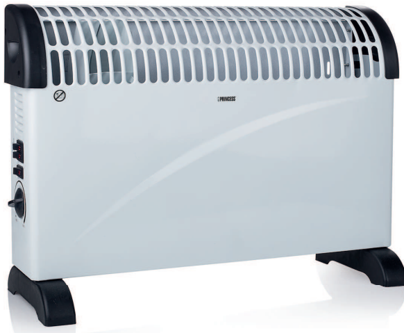
Electric heater (Convection) 01.345912.24.001

PARTS DESCRIPTION / ONDERDELENBESCHRIJVING / DESCRIPTION DES PIÈCES / TEILEBESCHREIBUNG / DESCRIPCIÓN DE LAS PIEZAS / DESCRIÇÃO DOS COMPONENTES / DESCRIZIONE DELLE PARTI / BESKRIVNING AV DELAR / OPIS CZĘŚCI / POPIS SOUČÁSTÍ / POPIS SOUČASTI / BESKRIVELSE AV DELER