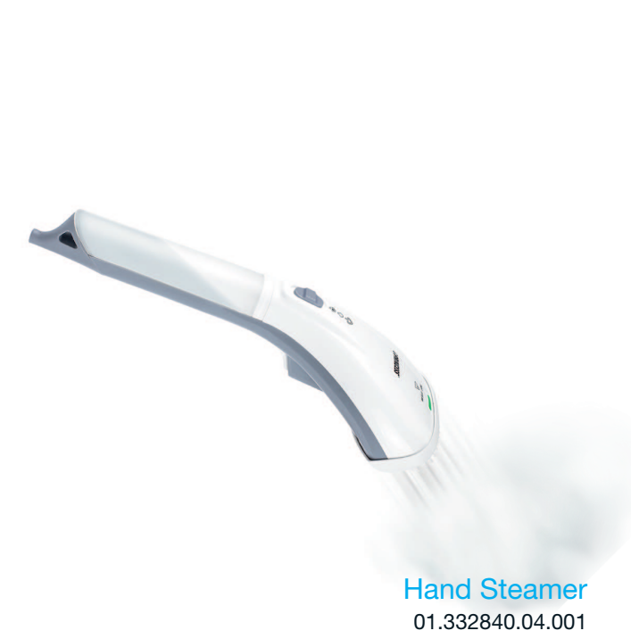
Hand Steamer 01.332840.04.001