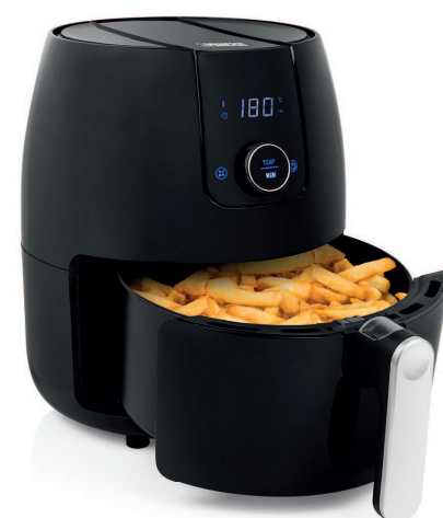
Digital Aerofryer XXL 01.182025.01.001

PARTS DESCRIPTION / ONDERDELENBESCHRIJVING / DESCRIPTION DES PIÈCES / TEILEBESCHREIBUNG / DESCRIPCIÓN DE LAS PIEZAS / DESCRIÇÃO DOS COMPONENTES / DESCRIZIONE DELLE PARTI / BESKRIVNING AV DELAR / OPIS CZĘŚCI / POPIS SOUČÁSTÍ / POPIS SUČASTÍ / ОПИСАНИЕ ЗАПЧАСТИ