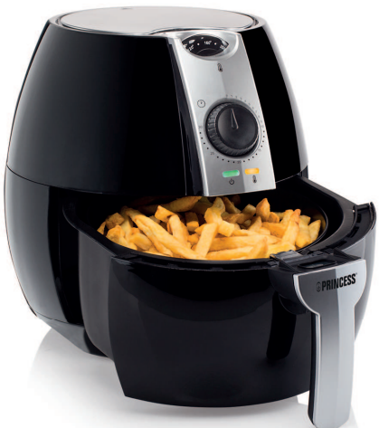
Aerofryer XL 01.182019.01.001

PARTS DESCRIPTION / ONDERDELENBESCHRIJVING / DESCRIPTION DES PIÈCES / TEILEBESCHREIBUNG / DESCRIPCION DE LAS PIEZAS / DESCRIÇÃO DOS COMPONENTES / OPIS CZĘŚCI / DESCRIZIONE DELLE PARTI / BESKRIVNING AV DELAR / POPIS SOUČÁSTÍ / POPIS SÚČASTÍ