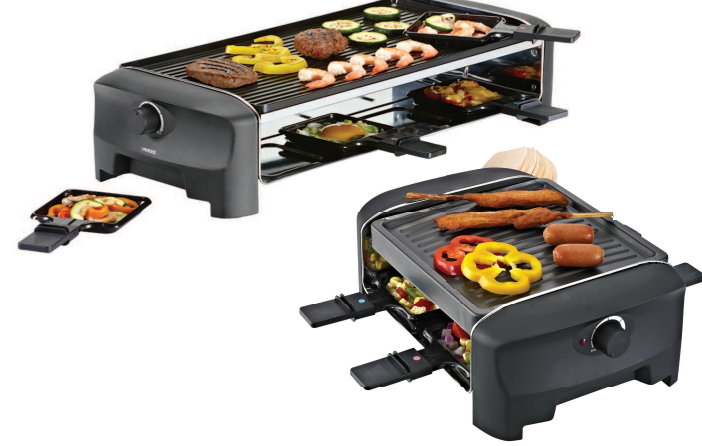
Raclette 4 Grill Party / Raclette 8 Grill and Teppanyaki Party 01.162800.01.001 / 01.162840.01.001

PARTS DESCRIPTION / ONDERDELENBESCHRIJVING / DESCRIPTION DES PIÈCES / TEILEBESCHREIBUNG / DESCRIPCIÓN DE LAS PIEZAS / DESCRIÇÃO DOS COMPONENTES / DESCRIZIONE DELLE PARTI / BESKRIVNING AV DELAR / OPIS CZĘŚCI / POPIS SOUČÁSTÍ / POPIS SUČASTÍ / PARÇALARIN AÇIKLAMASI