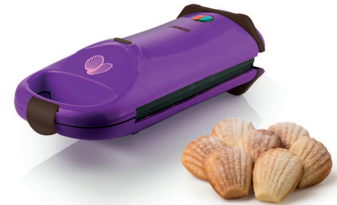
Madeleine Maker 01.132404.09.001