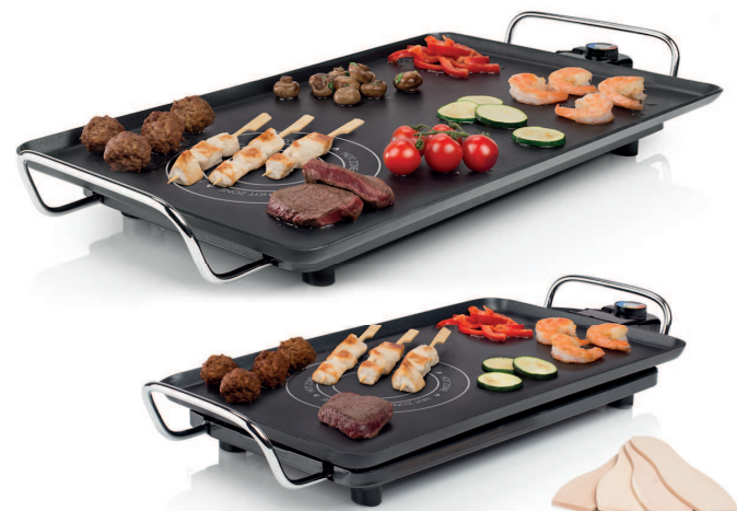
Table Chef Hot-zone / Table Chef Hot-zone XXL 01.103050.01.001 / 01.103051.01.001

PARTS DESCRIPTION / ONDERDELENBESCHRIJVING / DESCRIPTION DES PIÈCES / TEILEBESCHREIBUNG / DESCRIPCIÓN DE LAS PIEZAS / DESCRIÇÃO DOS COMPONENTES / DESCRIZIONE DELLE PARTI / BESKRIVNING AV DELAR / OPIS CZĘŚCI / POPIS SOUČÁSTI / POPIS SOUČASTI / BESKRIVELSE AV DELER