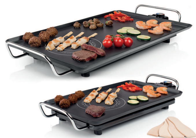
Table Chef Hot-zone / Table Chef Hot-zone XXL 01.103050.01.001 / 01.103051.01.001

PARTS DESCRIPTION / ONDERDELENBESCHRIJVING / DESCRIPTION DES PIÈCES / TEILEBESCHREIBUNG / DESCRIPCIÓN DE LAS PIEZAS / DESCRIÇÃO DOS COMPONENTES / DESCRIZIONE DELLE PARTI / BESKRIVNING AV DELAR / OPIS CZĘŚCI / POPIS SOUČÁSTÍ / POPIS SUČASTÍ / BESKRIVELSE AV DELER