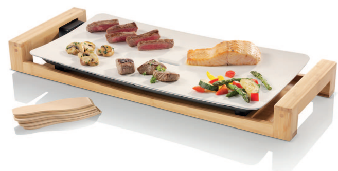
Table Chef Pure 01.103030.01.403

PARTS DESCRIPTION / ONDERDELENBESCHRIJVING / DESCRIPTION DES PIÈCES / TEILEBESCHREIBUNG / DESCRIPCIÓN DE LAS PIEZAS / DESCRICÃO DOS COMPONENTES / DESCRIZIONE DELLE PARTI / BESKRIVNING AV DELAR / OPIS CZĘŚCI / POPIS SOUČÁSTI / POPIS SUČASTI