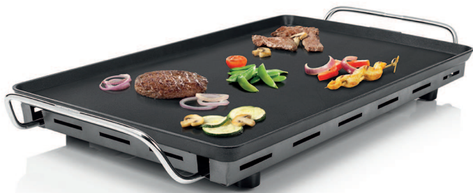
Table Chef XXL 01.102326.01.001

PARTS DESCRIPTION / ONDERDELENBESCHRIJVING / DESCRIPTION DES PIÈCES / TEILEBESCHREIBUNG / DESCRIPCIÓN DE LAS PIEZAS / DESCRIÇÃO DOS COMPONENTES / DESCRIZIONE DELLE PARTI / BESKRIVNING AV DELAR / OPIS CZĘŚCI / POPIS SOUČÁSTÍ / POPIS SÚČASTÍ / ОПИСАНИЕ ЗАПЧАСТИ