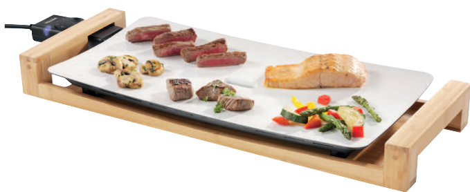
TISCHGRILL PURE TG 31.00