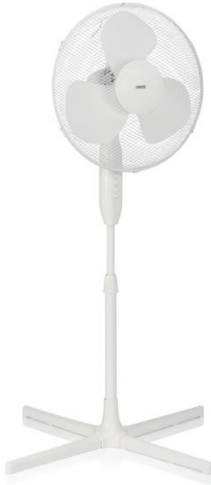
Stand fan 01.355840.01.001

PARTS DESCRIPTION / ONDERDELENBESCHRIJVING / DESCRIPTION DES PIÈCES / TEILEBESCHREIBUNG / DESCRIPCIÓN DE LAS PIEZAS / DESCRIÇÃO DOS COMPONENTES / DESCRIZIONE DELLE PARTI / BESKRIVNING AV DELAR / OPIS CZĘŚCI / POPIS SOUČÁSTÍ / POPIS SOUČASTI