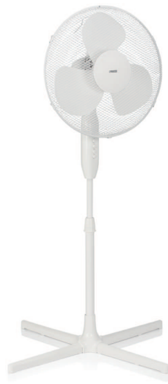
Stand fan 01.355840.01.001

Podpora Všetky dostupné informácie a náhradné diely nájdete na http://www.service.princess.info/ !