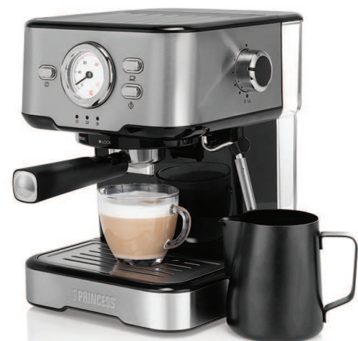
Espresso Machine 01.249415.01.001