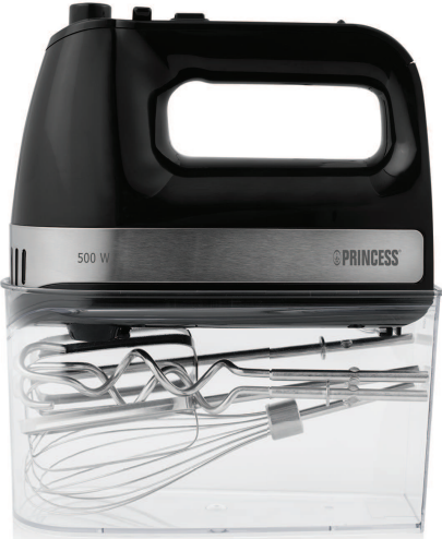
Hand mixer power 500 01.222206.01.001

PARTS DESCRIPTION / ONDERDELENBESCHRIJVING / DESCRIPTION DES PIÈCES / TEILEBESCHREIBUNG / DESCRIPCIÓN DE LAS PIEZAS / DESCRIÇÃO DOS COMPONENTES / DESCRIZIONE DELLE PARTI / BESKRIVNING AV DELAR / OPIS CZĘŚCI / POPIS SOUČÁSTI / POPIS SUČASTI / ОПИСАНИЕ ЗАПЧАСТИ