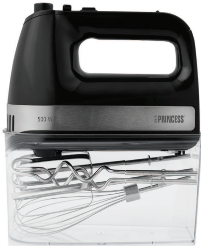
Hand mixer power 500 01.222206.01.001

PARTS DESCRIPTION / ONDERDELENBESCHRIJVING / DESCRIPTION DES PIÈCES / TEILEBESCHREIBUNG / DESCRIPCIÓN DE LAS PIEZAS / DESCRIÇÃO DOS COMPONENTES / DESCRIZIONE DELLE PARTI / BESKRIVNING AV DELAR / OPIS CZĘŚCI / POPIS SOUČÁSTÍ / POPIS SÚČASTÍ / ОПИСАНИЕ ЗАПЧАСТЕЙ