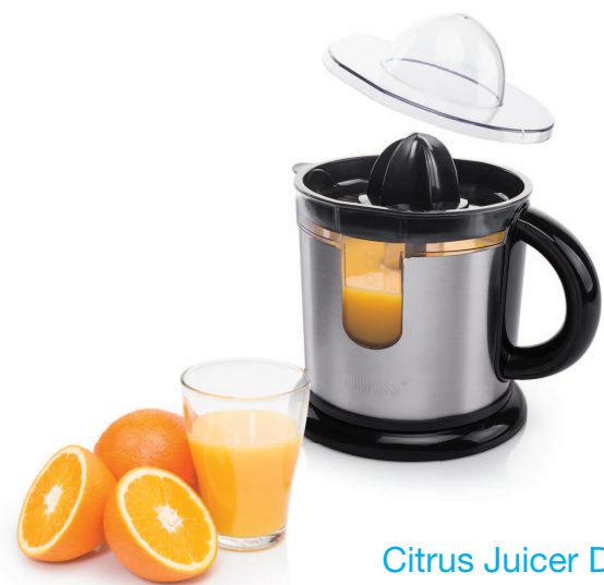
Citrus Juicer Duo 01.201975.01.001

PARTS DESCRIPTION / ONDERDELENBESCHRIJVING / DESCRIPTION DES PIÈCES / TEILEBESCHREIBUNG / DESCRIPCIÓN DE LAS PIEZAS / DESCRIÇÃO DOS COMPONENTES / DESCRIZIONE DELLE PARTI / BESKRIVNING AV DELAR / OPIS CZĘŚCI / POPIS SOUČÁSTÍ / POPIS SOUČASTÍ / ОПИСАНИЕ ЗАПЧАСТІ