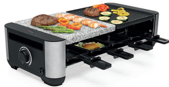
Raclette Premium Grill & Stone 01.162620.01.001

PARTS DESCRIPTION / ONDERDELENBESCHRIJVING / DESCRIPTION DES PIÈCES / TEILEBESCHREIBUNG / DESCRIPCION DE LAS PIEZAS / DESCRIÇÃO DOS COMPONENTES / DESCRIZIONE DELLE PARTI / BESKRIVNING AV DELAR / OPIS CZĘŚCI / POPIS SOUČÁSTÍ / POPIS SOUČASTI / ОПИСАНИЕ ЗАПЧАСТИ