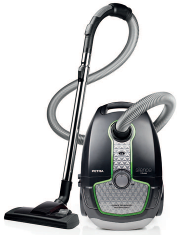
VACUUM CLEANER SILENCE DELUXE ST 10.07

PARTS DESCRIPTION / ONDERDELENBESCHRIJVING / DESCRIPTION DES PIÈCES / TEILEBESCHREIBUNG / DESCRIPCIÓN DE LAS PIEZAS / DESCRIÇÃO DOS COMPONENTES / DESCRIZIONE DELLE PARTI / BESKRIVNING AV DELAR / OPIS CZĘŚCI / POPIS SOUČÁSTÍ / POPIS SUČASTI وصف الأجزاء