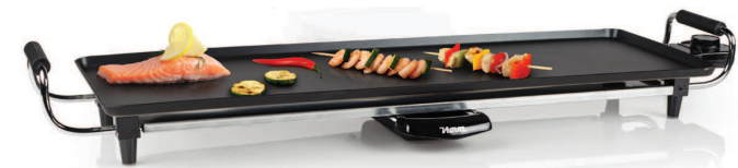
TABLE CHEF XL 02.103015.01.001

PARTS DESCRIPTION / ONDERDELENBESCHRIJVING / DESCRIPTION DES PIÈCES / TEILEBESCHREIBUNG / DESCRIZIONE DELLE PARTI / BESKRIVNING AV DELAR / COMPONENTES / DESCRIZIONE DELLE PARTI / BESKRIVNING AV DELAR / OPIS CZĘŚCI / POPIS SOUČÁSTÍ / POPIS SOUČASTÍ