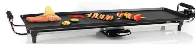
TABLE CHEF XL 02.103015.01.001

PARTS DESCRIPTION / ONDERDELENBESCHRIJVING / DESCRIPTION DES PIÈCES / TEILEBESCHREIBUNG / DESCRIPCIÓN DE LAS PIEZAS / DESCRIÇÃO DOS COMPONENTES / DESCRIZIONE DELLE PARTI / BESKRIVNING AV DELAR / OPIS CZĘŚCI / POPIS SOUČÁSTÍ / POPIS SÚČASTÍ