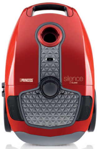
Vacuum Cleaner Silence DeLuxe 01.335400.01.001

PARTS DESCRIPTION / ONDERDELENBESCHRIJVING / DESCRIPTION DES PIÈCES / TEILEBESCHREIBUNG / DESCRIÇÃO DE LAS PIEZAS / DESCRIÇÃO DOS COMPONENTES / DESCRIZIONE DELLE PARTI / BESKRIVNING AV DELAR / OPIS CZĘŚCI / POPIS SOUČÁSTÍ / POPIS SOUČASTÍ