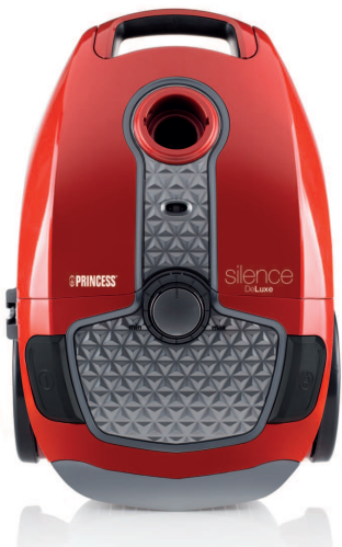
Vacuum Cleaner Silence DeLuxe 01.335400.01.001

PARTS DESCRIPTION / ONDERDELENBESCHRIJVING / DESCRIPTION DES PIÈCES / TEILEBESCHREIBUNG / DESCRIPCIÓN DE LAS PIEZAS / DESCRIÇÃO DOS COMPONENTES / DESCRIZIONE DELLE PARTI / BESKRIVNING AV DELAR / OPIS CZĘŚCI / POPIS SOUČÁSTÍ / POPIS SÚČASTÍ