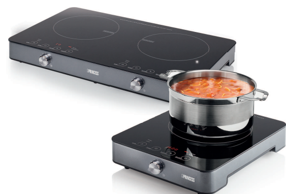
Princess Induction Plate 01.303010.01.001 / 01.303011.01.001

PARTS DESCRIPTION / ONDERDELENBESCHRIJVING / DESCRIPTION DES PIÈCES / TEILEBESCHREIBUNG / DESCRIPCIÓN DE LAS PIEZAS / DESCRIÇÃO DOS COMPONENTES / DESCRIZIONE DELLE PARTI / BESKRIVNING AV DELAR / OPIS CZĘŚCI / POPIS SOUČÁSTÍ / POPIS SUČASTÍ / ОПИСАНИЕ ЗАПЧАСТИ