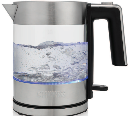
Glass kettle Brighton 01.236040.01.001

PARTS DESCRIPTION / ONDERDELENBESCHRIJVING / DESCRIÇÃO DAS PEÇAS / TEILEBESCHREIBUNG / DESCRIPCIÓN DE LAS PIEZAS / DESCRIÇÃO DOS COMPONENTES / DESCRIZIONE DELLE PARTI / BESKRIVNING AV DELAR / OPIS CZĘŚCI / POPIS SOUČÁSTI / POPIS SUČASTI / ОПИСАНИЕ ЗАПЧАСТИ