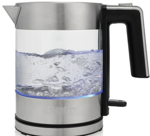
Glass kettle Brighton 01.236040.01.001

PARTS DESCRIPTION / ONDERDELENBESCHRIJVING / DESCRIPTION DES PIÈCES / TEILEBESCHREIBUNG / DESCRIPCIÓN DE LAS PIEZAS / DESCRIÇÃO DOS COMPONENTES / DESCRIZIONE DELLE PARTI / BESKRIVNING AV DELAR / OPIS CZĘŚCI / POPIS SOUČÁSTI / POPIS SUČASTI / ОПИСАНИЕ ЗАПЧАСТИ