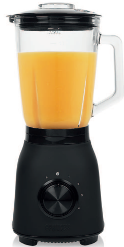
Blender Black Steel 1000 01.212092.01.001

PARTS DESCRIPTION / ONDERDELENBESCHRIJVING / DESCRIPTION DES PIÈCES / TEILEBESCHREIBUNG / DESCRIPCIÓN DE LAS PIEZAS / DESCRIÇÃO DOS COMPONENTES / DESCRIZIONE DELLE PARTI / BESKRIVNING AV DELAR / OPIS CZĘŚCI / POPIS SOUČÁSTI / POPIS SUČASTI / ОПИСАНИЕ ЗАПЧАСТИ