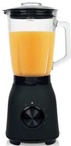
Blender Black Steel 1000 01.212092.01.001

PARTS DESCRIPTION / ONDERDELENBESCHRIJVING / DESCRIPTION DES PIÈCES / TEILEBESCHREIBUNG / DESCRIPCIÓN DE LAS PIEZAS / DESCRIÇÃO DOS COMPONENTES / DESCRIZIONE DELLE PARTI / BESKRIVNING AV DELAR / OPIS CZĘŚCI / POPIS SOUČÁSTI / POPIS SUČASTI / ОПИСАНИЕ ЗАПЧАСТИ