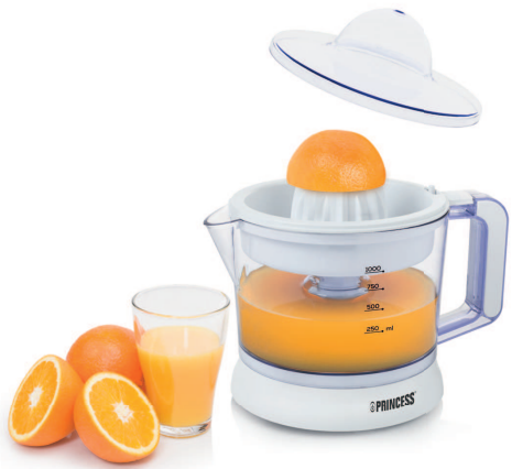
Citrus Juicer Classic عصرارة الحمضيات كلاسيك بلاك 01.201004.04.001